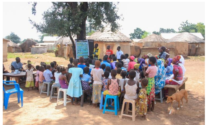
Kerk in Noord-Ghana leert mensen in afgelegen dorpen lezen en schrijven Zie de video https://vimeo.com/395657393